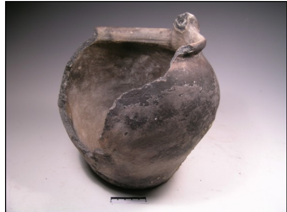
Inheemse pot met aanzet voor een hengsel.

Handgemaakt aardewerk was gewoonlijk het product van huisvlijt, vervaardigd langs lijnen van traditie, doorgegeven van moeder op (schoon)dochter. Veranderingen kwamen traag en meestal van buitenaf. Maar af en toe moet er iets zijn opgetreden dat op eigen initiatief lijkt. Dat geldt bijvoorbeeld voor zogenaamde zwaluwnest-oren, waarbij de hals aan weerszijden werd doorboord en om de gaten een halfronde kapje werd geplaatst. De pot werd dan blijkbaar toch boven het vuur gehangen en de kapjes zorgden er voor - in principe tenminste - dat het touw niet doorbrandde. Zwaluwnest-oren werden uitgevonden in de Romeinse tijd, zonder mode te worden, en vervolgens weer in de zesde-zevende eeuw (een bekend voorbeeld stamt uit Leens, uit een