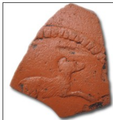
Een scherp terra sigillata (Romeins importaardewerk), gevonden op de terp Techum onder Goutum.