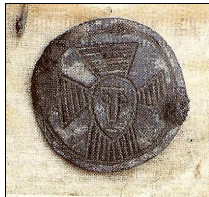
De fibula van Raerd (Boarnsterhim).

Dit artikel werd met toestemming overgenomen uit het Friesch Dagblad van 1 februari 2010.