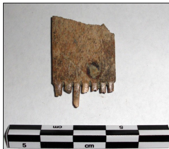
Benen tandplaatje uit samengestelde kam.