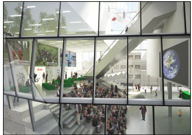
Vide met roltrappen in het nieuwe Groninger Forum.

Nieuwe aanwinsten van het Groninger Museum zullen ook via die website geraadpleegd kunnen worden. Het Groninger Museum bezit ook een grote verzameling munten en penningen die in of voor Groningen gemaakt zijn. Deze collectie is, samen met ander materiaal, te raadplegen op www.numismaticagroningana.nl . Het internet biedt ongekende mogelijkheden om historische collecties voor een breed publiek integraal beschikbaar te stellen. De collectie van het Groninger Museum is nu al voor een deel al te raadplegen op www.Groningermuseum.nl , zoals veel beeldmateriaal van de provincie Groningen via