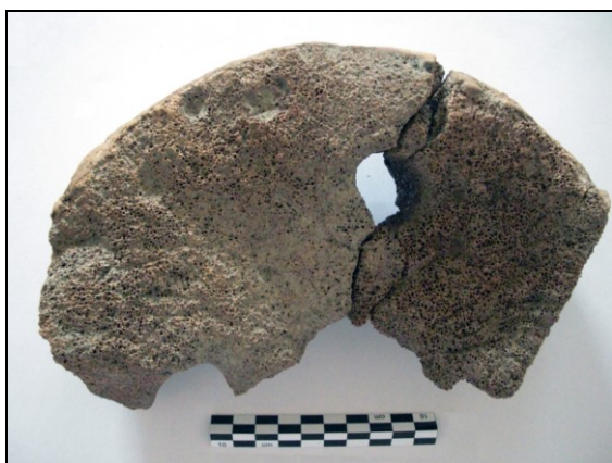
Vijftiende staartwervel van een potvis met twee doorboringen.

Er zijn enkele opvallende vondsten naar voren gekomen. Ten eerste is te Achlum een doorboorde wervel van walvisbot aangetroffen, afkomstig uit de late middeleeuwen. Het is een wervel uit de staart van een potvis. Waarvoor de wervel is gebruikt is niet duidelijk. Het is mogelijk dat de wervel gebruik is voor het verzwaren van visnetten.