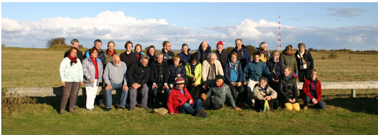
De deelnemers aan de excursie naar Noord-Friesland op Sult.