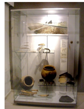
Een kijkje in het Muzeeaquarium.

Op 1 mei 1916 werd de Vereniging voor Terpenonderzoek te Groningen opgericht. In dat jaar en in 1917 verrichtte A.E. van Giffen een opgraving in de wierde De Wierhuizen, bij Appingedam. Onze toen net opgerichte vereniging financierde deze opgraving. Van Giffen publiceerde over de opgraving in de Jaarverslagen 1 en 2. In de jaren 1980 verrichtte J.W. Boersma opgravingen in de wierde van Heveskesklooster. Het Muzeeaquarium in Delfzijl heeft onder meer een tentoonstelling over deze opgravingen. Daarbij kwamen vondsten uit een periode van 4500 jaar (trechterbekerperiode tot en met late middeleeuwen) te voorschijn. Er is dus alle reden om onze feestelijke jaarvergadering in Delfzijl en omgeving te houden.