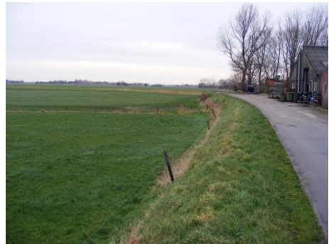
De Wierhuizen naar het noorden.

Vervolgens gebruiken we in De Molenberg de lunch. Om 13:30 uur vormen we twee groepen. De eerste groep gaat per bus naar Heveskesklooster, vervolgens naar De Wierhuizen en wordt daarna afgezet bij het Muzeeaquarium. De tweede groep bezoekt eerst het Muzeeaquarium, en wordt daar om 15:00 uur afgehaald voor het rondje langs Heveskesklooster en De Wierhuizen. Om 16:30 uur wordt ook deze groep weer afgezet bij het Muzeeaquarium. Desgewenst kunt u na afloop op eigen kosten nog wat gebruiken in het Eemshotel tegenover het Muzeeaquarium, of in restaurant De Boegschroef aan de haven, Handelskade West 16.