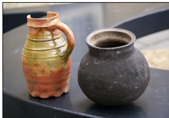
De vondsten die Yep Hettinga deed toen hij na afloop van het onderzoek nog een waterput leegmaakte.