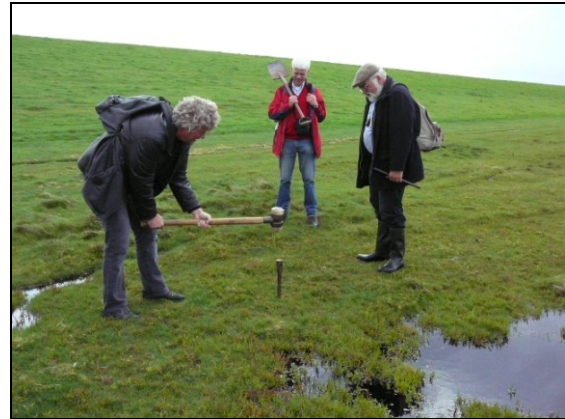
In de Deense Waddenzee is in september 2008 inventariserend onderzoek gedaan naar de geologische ontstaansgeschiedenis en de bewoningsgeschiedenis van het eiland Mando 5 .