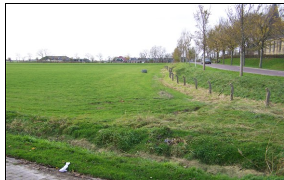
Blik op de opgravingslocatie in Achlum, gezien vanuit het oosten: rechts de dorpskerk, links op de achtergrond het talud en op de voorgrond het afgegraven terpdeel.