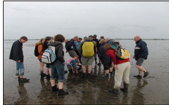
Stilstaan bij een steen van een kerkgebouw.

De Waddenzee op lopen, de vaste grond van de zeedijk achter je laten, in een lange rij van wadlopers richting de horizon. Een nieuwe wereld in van zee en vogels en wind. Het Wad ligt vol met stenen die van de verdronken dorpen afkomstig zijn. Sommige zijn waarschijnlijk