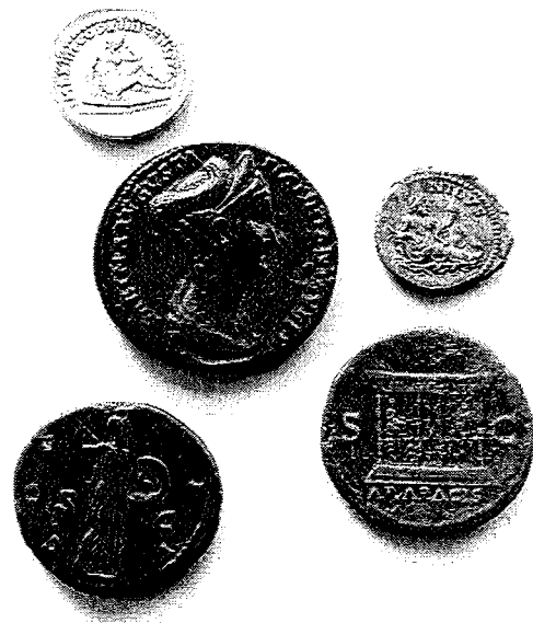
Enkele Romeinse munten uit Friesland

De tentoonstelling vindt plaats in het kader van een samenwerkingsverband tussen het Fries Museum en de Stichting Munt- en Penningkabinet. Het Fries Museum stelt twee tentoonstellingen samen over munten, die zowel in het Munt- en Penningkabinet als in het Fries Museum getoond zullen worden. De eerste tentoonstelling gaat over Romeinse munten in Friesland. Er worden ruim 350 munten uit de collectie van het Fries Museum geëxposeerd, waaronder de muntschat van